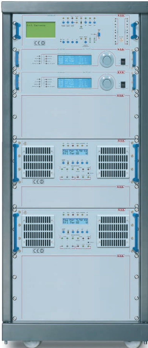
TX10KW BARRACUDA front view